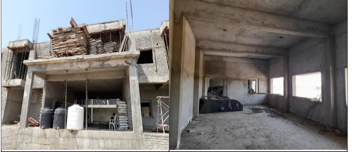
दिनांक 22.03.2021 तक बालिका छात्रावास, टोंक का अधूरा निर्माण कार्य

विभागीय प्रतिनिधियों के साथ किये गए (मार्च 2021) बालिका छात्रावास भवन, टोंक के संयुक्त भौतिक निरीक्षण में भी इस तथ्य की पुष्टि हुई कि निर्माण कार्य अधूरा था जैसा कि निम्न चित्रों में दिखाया गया है: